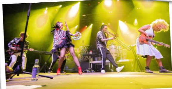
Festival Portamérica 2019 - Monsieur Periné